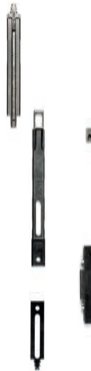
BASISSET 35110-3 (DRAAI-KIP STANDAARD)